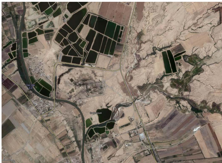
شکل ۱: موقعیت رودخانه گرگر در منطقه.

(power Ahvaz, 2004). این رودخانه ضمن تأمین آب شرب شهرستان شوشتر، هفتگل، بخشی از رامهرمز و روستاهای آن، در زمره یکی از قطب‌های بزرگ پرورش ماهی استان بشمار می‌آید (Jafari Tabard et al. , 2007). به‌گونه‌ای که حدود ۱۵۰۰ حوضچه پرورش ماهی در اطراف این رودخانه با وسعت حدوداً ۱۵۰۰ هکتار، آب مصرفی خود را از آن تأمین می‌نمایند. همچنین از آب این رودخانه برای سایر مصارف مانند کشتارگاه شوشتر و تصفیه‌خانه سید حسن استفاده می‌شود. از این رو این رودخانه برای بسیاری از سازمان‌ها و نهادها مانند شیلات، وزارت نیرو، جهاد کشاورزی، آب و فاضلاب و مردم منطقه از اهمیت خاصی برخوردار است (Jafarzadeh, 2006). محدوده مطالعات شامل مسیر رودخانه در فاصله بند میزان در شوشتر تا بند قیر می‌باشد.